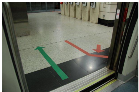
2. Métro « civilisé »