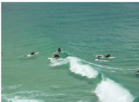
3. Surfeurs à Byron Bay