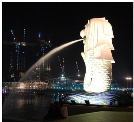
1. Merlion: symbole de Singapour

Ce court séjour m'a permis de rencontrer quelques personnes très intéressantes d'horizons divers. Singapour est une ville étonnante, propre, moderne et sécurisée. Le mélange culturel est impressionnant !!!