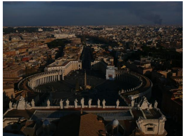
Vue depuis la coupole de la basilique St Pierre