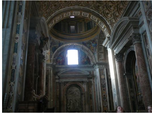
La basilique St Pierre