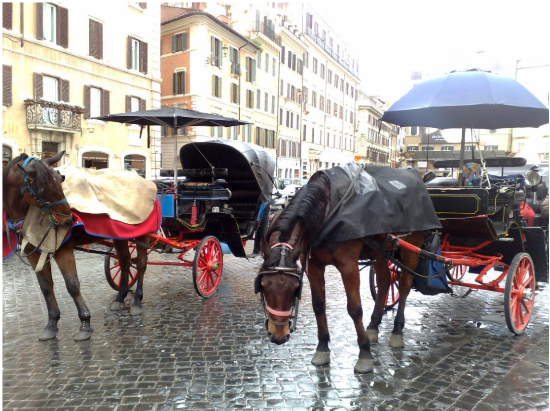
Piazza di Spagna