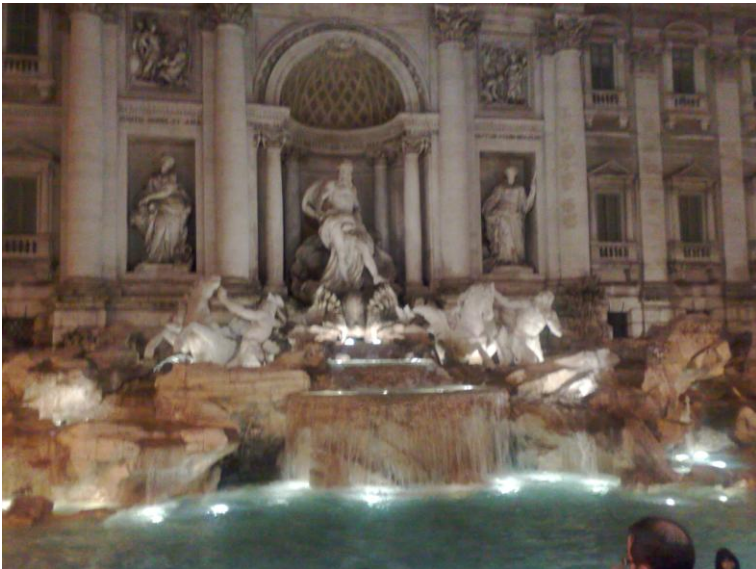
Fontaine de Trévi